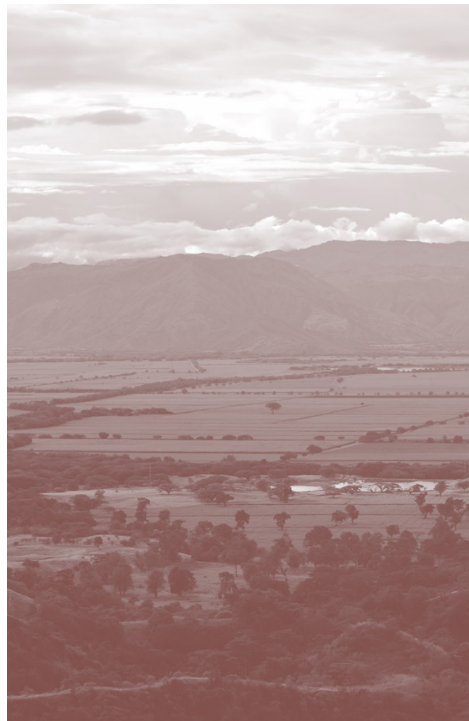
VALLE DEL CAUCA

Con miras a potenciar los esfuerzos de inversión de impacto en el país, consolidándose como el modelo de inversión financiera del futuro, el NAB se ha propuesto aumentar el flujo de capital privado a sectores de impacto social y ambiental, articular y fortalecer el ecosistema de impacto colombiano; desarrollar conocimiento e investigación para fortalecer la evidencia y la relevancia y trabajar eficientemente con el gobierno nacional para favorecer a quienes invierten con enfoque sostenible en Colombia; y ha convocado diferentes personas y organizaciones a construir el camino hacia un modelo en el que el impacto, sea el centro de la economía y de las decisiones de inversión en Colombia.