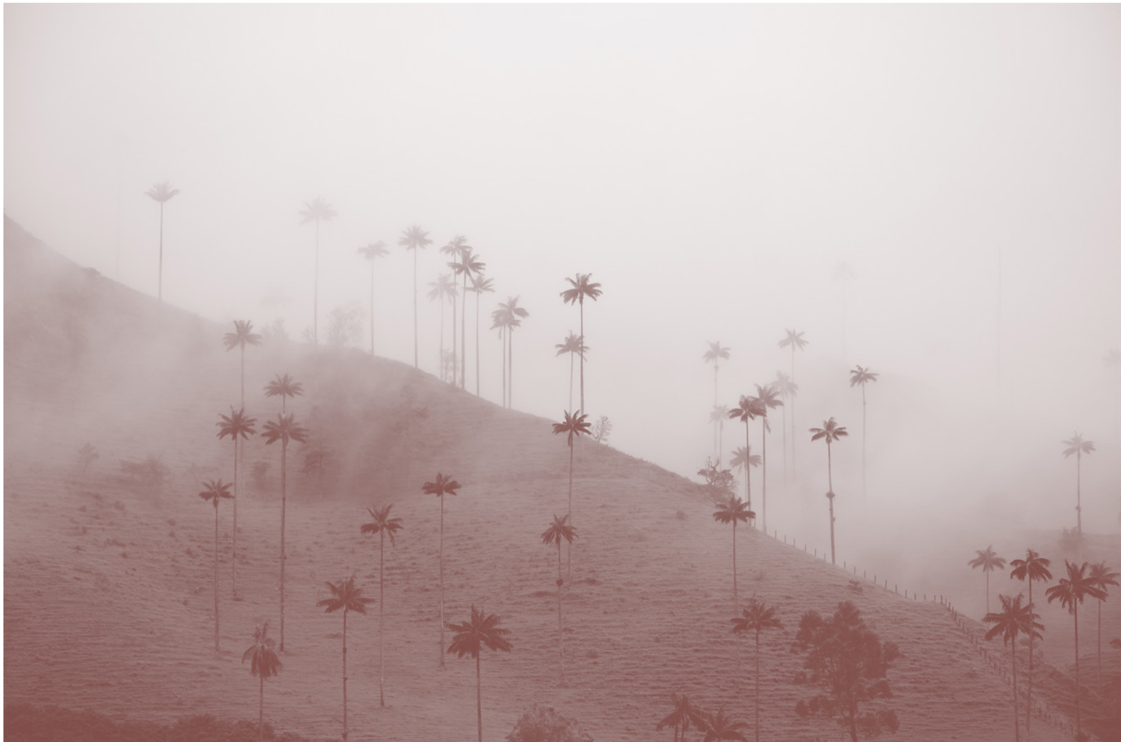
VALLE DEL COCORA, QUINDÍO