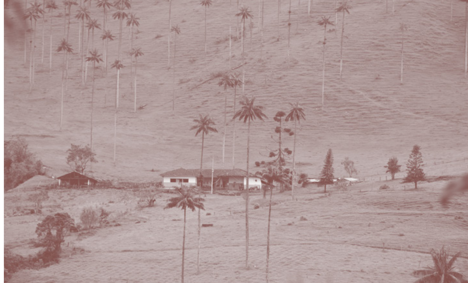
VALLE DEL COCORA, QUINDÍO

“ En un ecosistema vibrante para generar impacto, todo tipo de capital colabora en invertir a lo largo de ese continuo de capital. No hay una forma única de invertir, y por eso es necesario saber dónde se sitúa cada actor en este ecosistema de inversión social”.