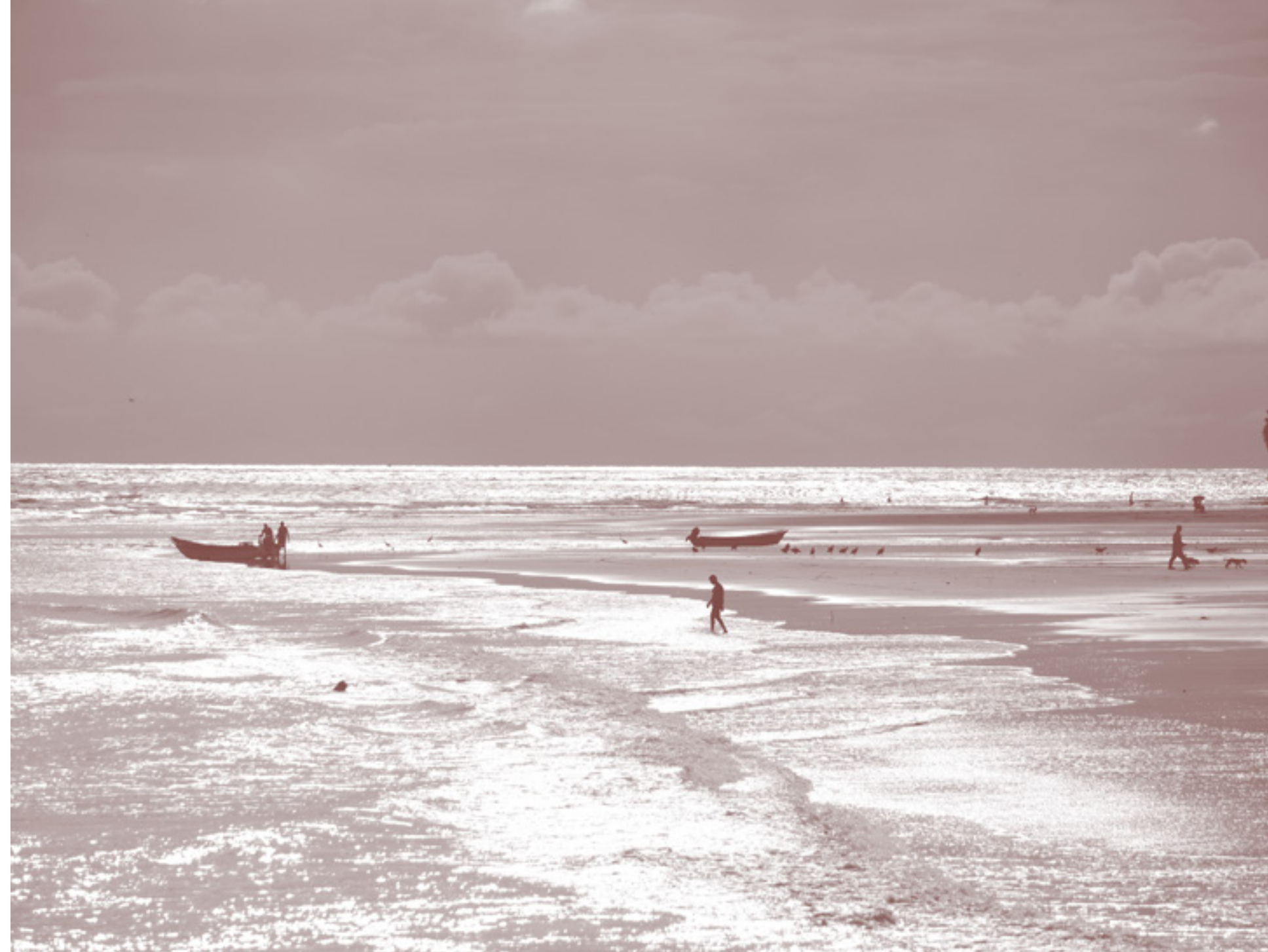
LADRILLEROS, VALLE DEL CAUCA

R. A quienes quieran hacer empresa, a las personas que están confundidas pensando si le están dedicando mucho tiempo a un negocio y poco tiempo a su familia, por ejemplo. A los que tienen proyectos y compiten con otros que tal vez no lo hagan de una forma honesta. Es muy valioso entender que la creación de una empresa va más allá que el producto o el servicio que ofrece. Es la construcción de valores para la sociedad, porque apoyando a aquellos con quienes se trabaja, se logra también que sean