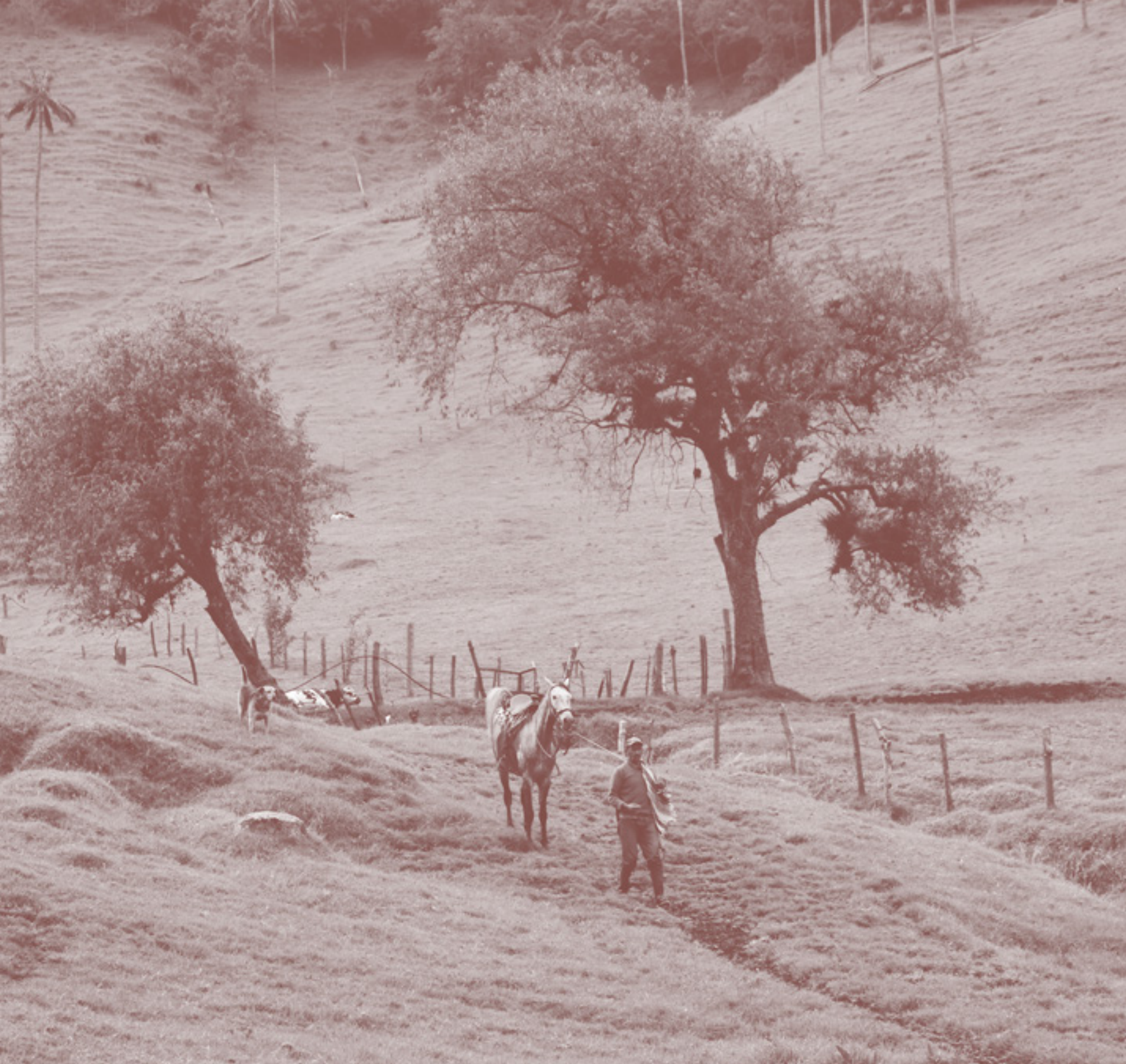
VALLE DEL COCORA, QUINDÍO

Iniciativas como GOYN (Global Opportunity Youth Network), que busca ofrecer oportunidades y reconectar jóvenes que no estudian, no trabajan, o se encuentran en la informalidad (Jóvenes con Potencial), generando aprendizajes desde diferentes ciudades a nivel global, una de esas Bogotá. GOYN Bogotá ha seguido el enfoque sistémico y están generando avances a través de: una visión de largo plazo (2030), involucramiento activo de los jóvenes y todos los actores que hacen parte del sistema, analizando y compartiendo los datos territoria-