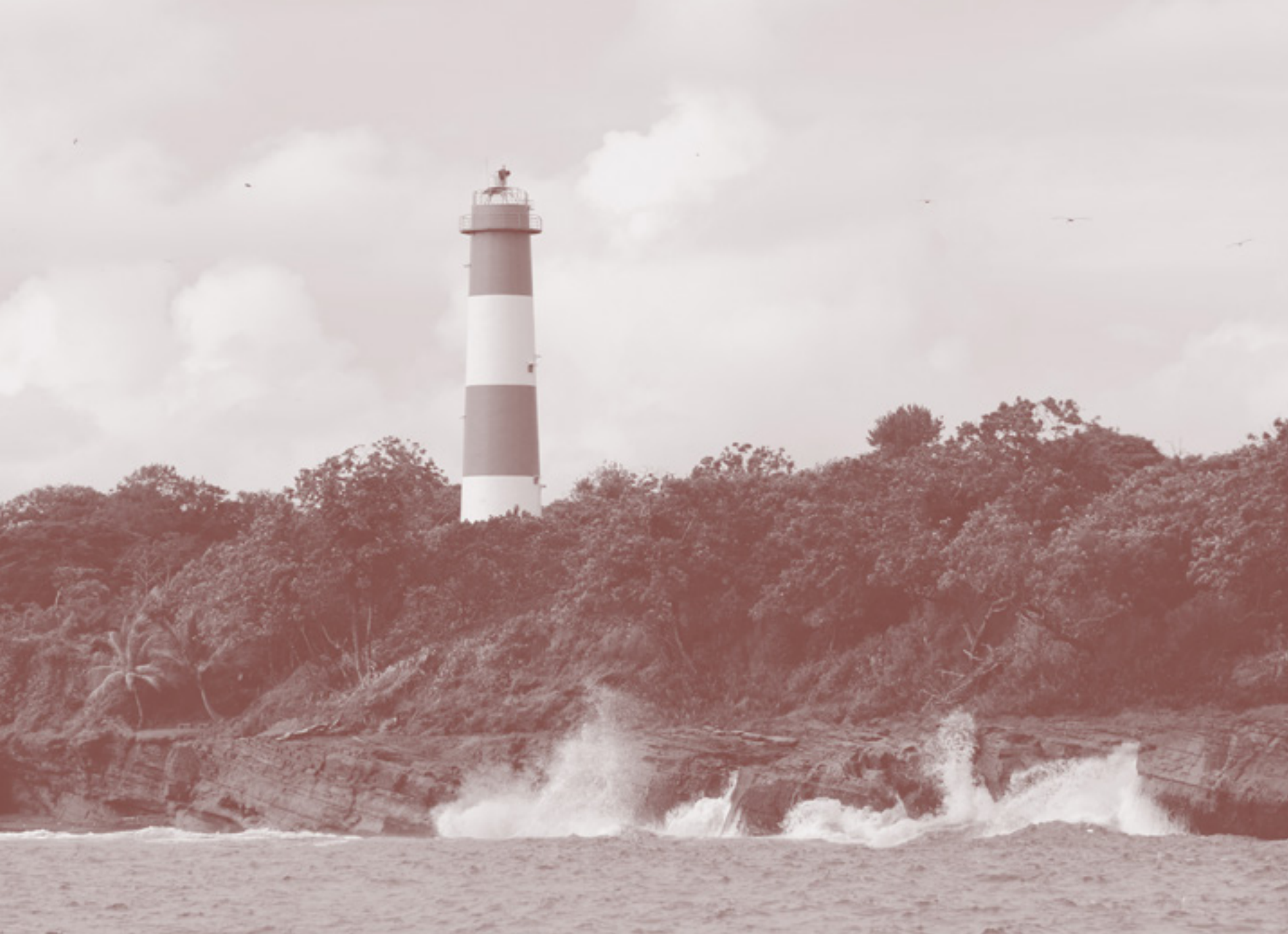
LADRILLEROS, VALLE DEL CAUCA

Desde el inicio, el equipo del FRC estuvo en diálogo con las agencias estatales encargadas de implementar políticas de emergencia en la pandemia, colaborando con diagnósticos e innovaciones para aportar en la respuesta del Estado. En paralelo, la iniciativa fue evaluada por un equipo del Programa de las Naciones Unidas para el Desarrollo (PNUD) para cuantificar la efectividad, identificar aportes críticos y unificar aprendizajes para mejorar los programas sociales de apoyo a las situaciones de emergencia.