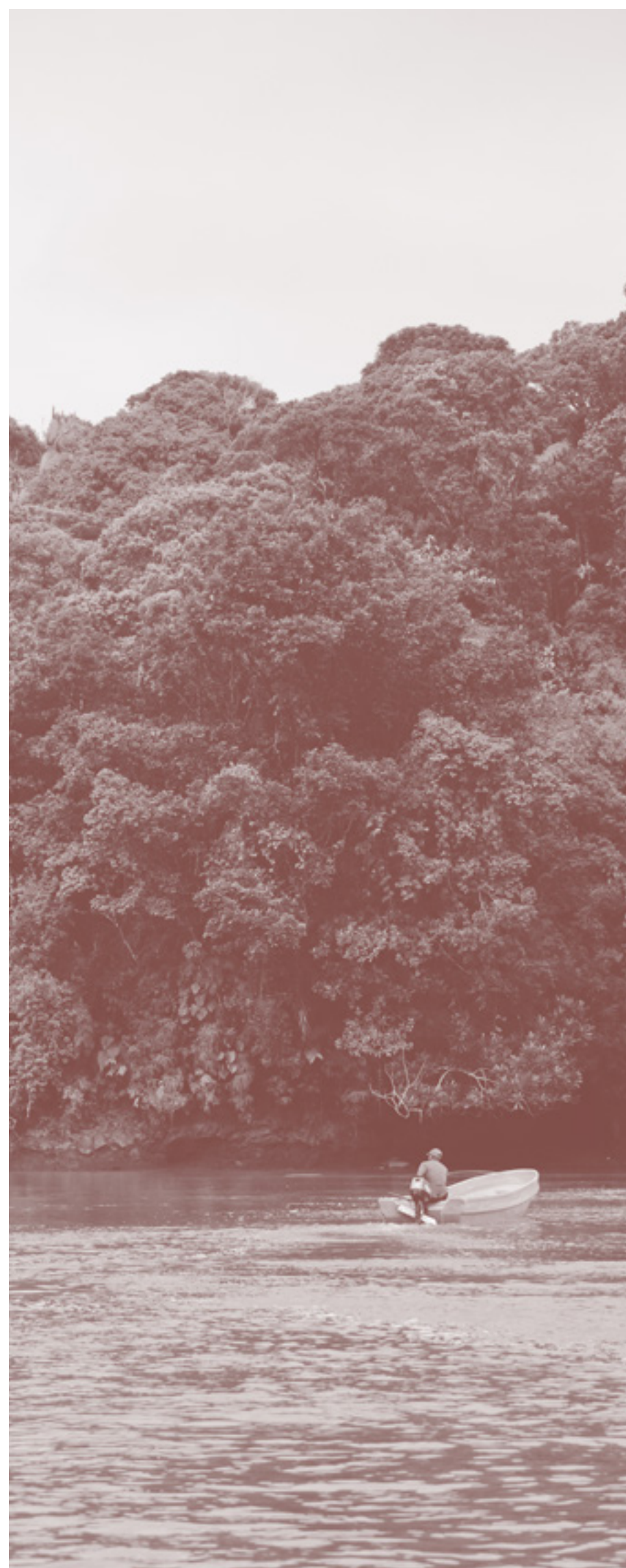
LADRILLEROS, VALLE DEL CAUCA

En la primera etapa la Fundación Luker, como muchas otras, empezó como un gran banco de proyectos. Y puede sonar exa-