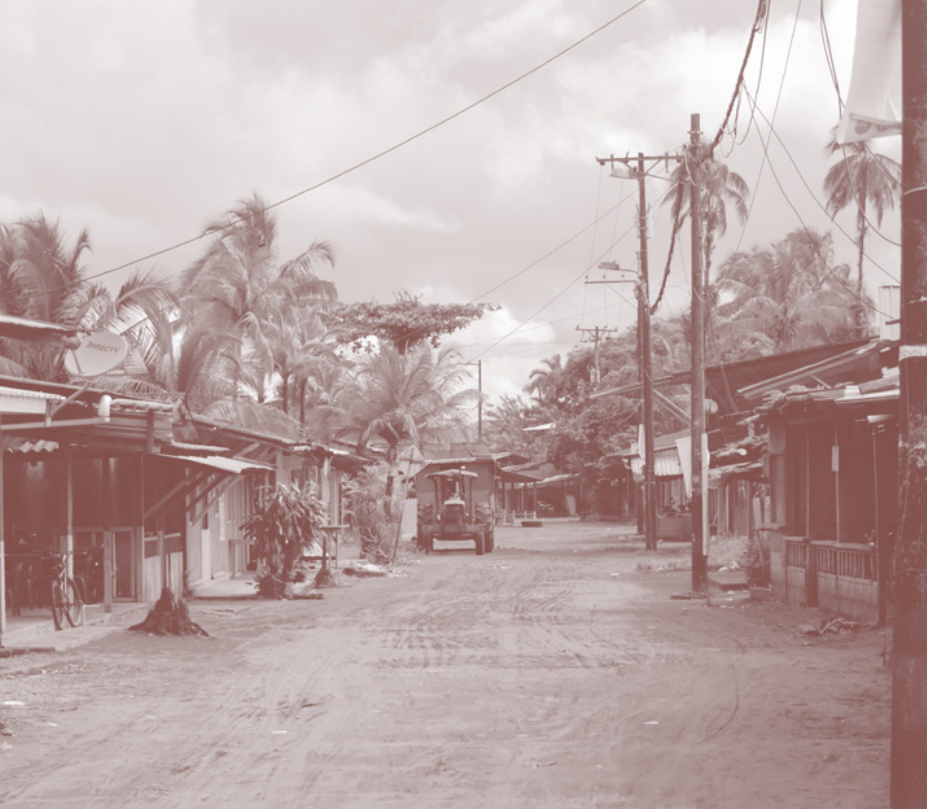
LADRILLEROS, VALLE DEL CAUCA

modelo pedagógico, está consolidado por tres pilares: educación, deporte, y modelos a seguir.