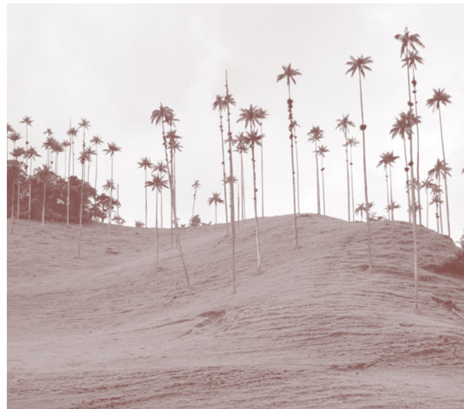
VALLE DEL COCORA, QUINDÍO

“ Hoy buscamos incidir junto con otros actores en el desarrollo de competencias de nuestros maestros desde el Saber, Hacer y el Ser, generando mejores ambientes de aprendizaje que favorezcan la permanencia escolar de las niñas, niños y jóvenes a lo largo de sus trayectorias educativas”.